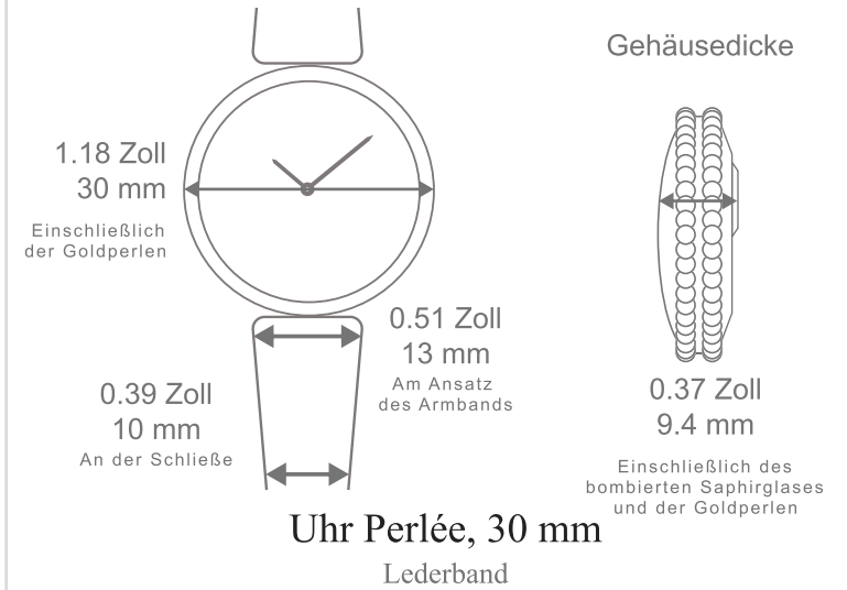
Uhr Perlée, 30 mm Lederband

In Originalgröße ausdrucken, um die tatsächliche Größe des Gehäuses zu sehen.