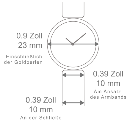
Uhr Perlée, 23 mm Goldarmband