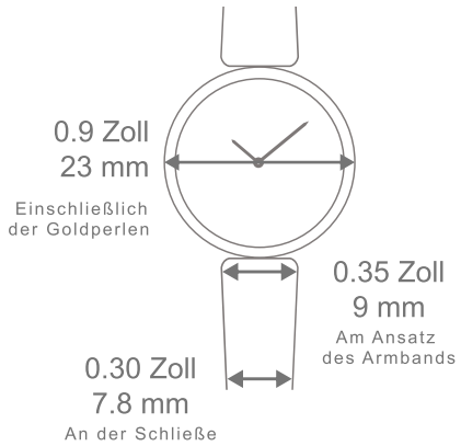
Uhr Perlée, 23 mm Lederband