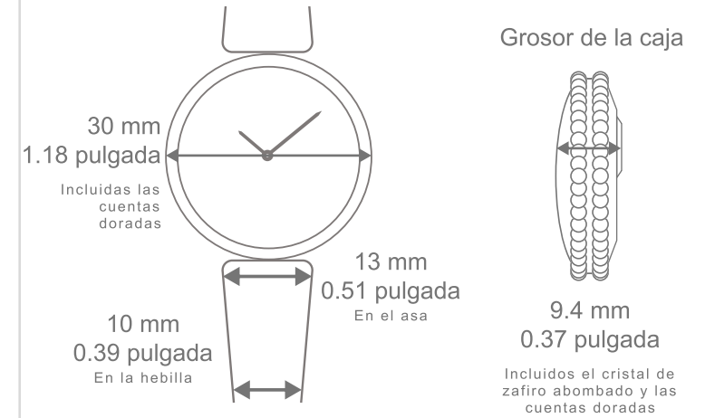
Reloj Perlée, 30 mm Correa de piel

8.9 mm 0.35 pulgada Incluidos el cristal de zafiro abombado y las cuentas doradas