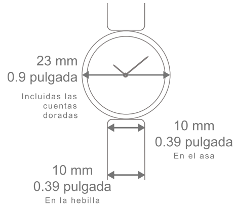
Reloj Perlée, 23 mm Brazaletes de oro