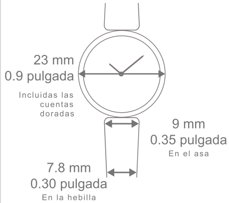
Reloj Perlée, 23 mm Correa de piel